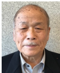
成蹊ラグークラブ