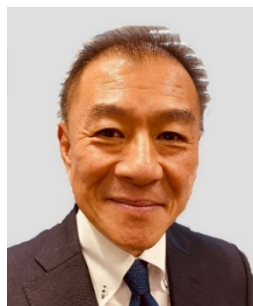
成蹊ラグークラブ

今回改めて100周年に向け皆様のご厚情を賜りたくご寄附をお願いする次第でございます。何卒ご協力のほど宜しくお願い申し上げます。