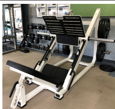
【寄贈・ウエイト器具】